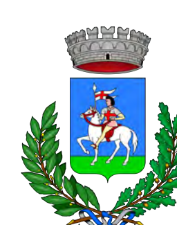
Comune di Sant'Albano Stura