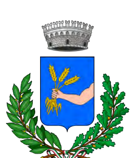
Comune di Farigliano