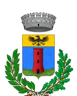
Comune di Frabosa