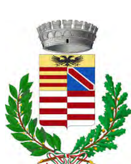
Comune di Genola