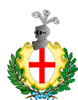
Comune di Narzole