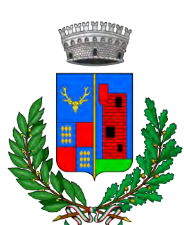
Comune di Cervere