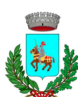
Comune di Montanera