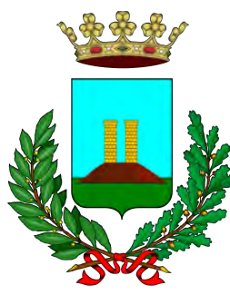
Comune di Bastia