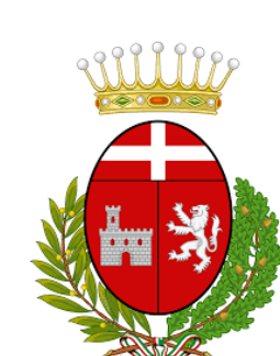
Comune di Salmour