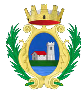
Comune di Castelletto Stura