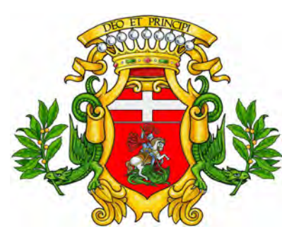
Comune di Bene Vagienna