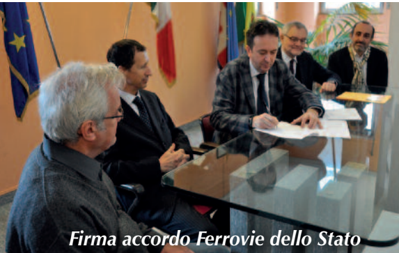
Firma accordo Ferrovie dello Stato

obiettivo non semplice da raggiungere attraverso un dialogo particolarmente difficoltoso. Per questo motivo ed in ragione di un'esigenza particolarmente sentita dalla cittadinanza non possiamo che dirci soddisfatti. Certo la realizzazione della pista ciclabile e la ristrutturazione dei fabbricati rappresentano sfide ambiziose che ancora devono essere vinte, ma pensiamo che il risultato già raggiunto si possa, a ragione, definire storico. Dobbiamo sottolineare il fatto che per raggiungere questo risultato è stato determinante il contributo di numerose persone ed associazioni che ci hanno sostenuto: non essendo possibile elencarli singolarmente, ringraziamo tutti indistintamente, ricordando in particolare "Legambiente" e "Gli Amici degli Equini", che armati di molta voglia e pochi mezzi, hanno ripulito il sedime; la Regione Piemonte per il sostegno "istituzionale", indispensabile in questi casi; il comune di Bibiana, che ha collaborato con noi nell'organizzazione di numerosi eventi. Insomma, un gran lavoro di squadra che speriamo non si interrompa, ma che divenga ancor più determinante per portare a termine un bellissimo progetto che può, finalmente, diventare realtà.