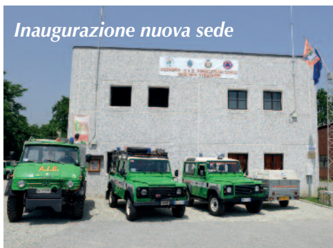
Inaugurazione nuova sede