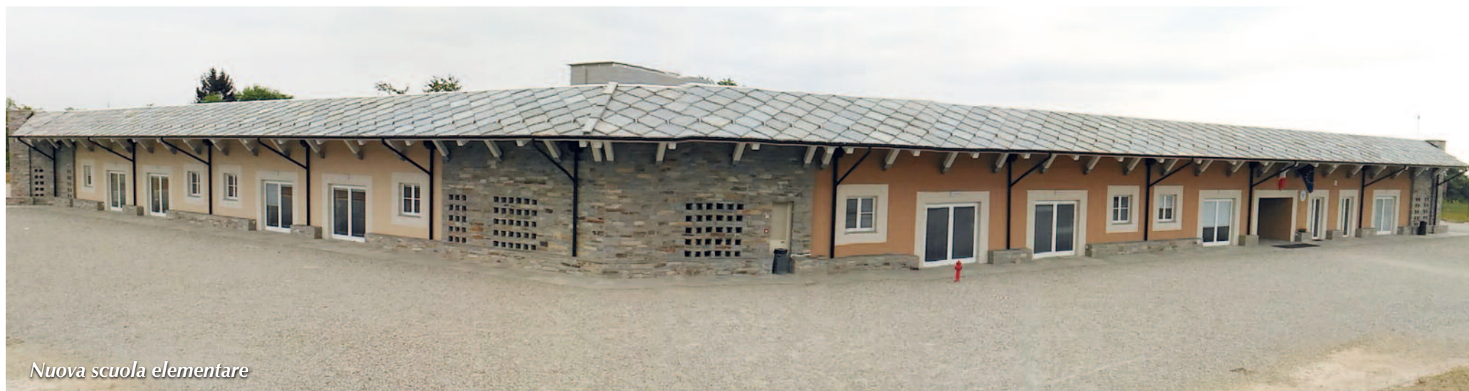
Nuova scuola elementare